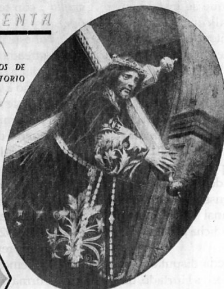
PRIEGO DE CORDOBA