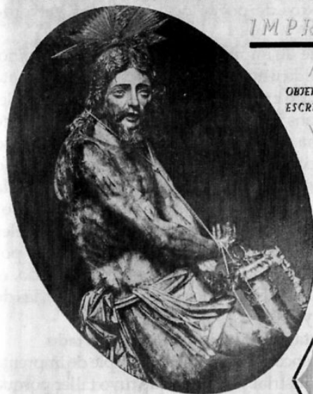
Torrejón número 7.